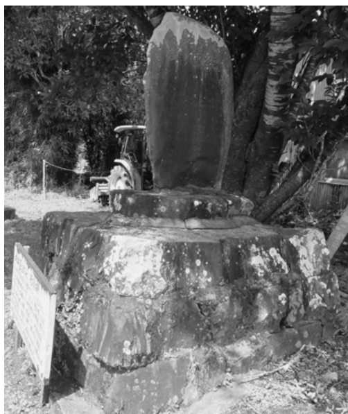
向井喜之助氏紀徳碑