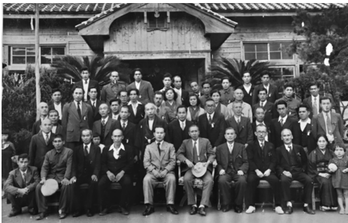
鴻峰小学校舎移転改築落成記念（昭和27年）

バスも運行し、昭和三十二年には電灯も灯った。ところで昭和三六年現在、中割校区の人口は八百余名、百数十戸、大半は製炭との兼業農家である。出身地別に見ると、奄美大島郡出身が六〇割、桜島一二割、甌島一割、熊毛郡内一七割、その他一〇割となっている。