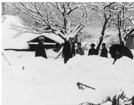
大雪が降った日（昭和38年頃）