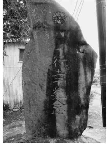
十六番行幸記念碑