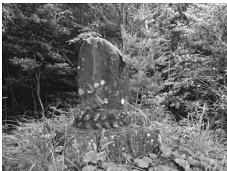
七尋五葉松の自生地の碑