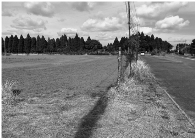
移住者を受け入れた長屋跡現在の様子

た。その後、昭和十年（一九三五）ごろから、奄美大島からの移住者が急激に増え、現在は大半が奄美大島出身者であり、初代の桜島移住民は、わずか四戸だけである。