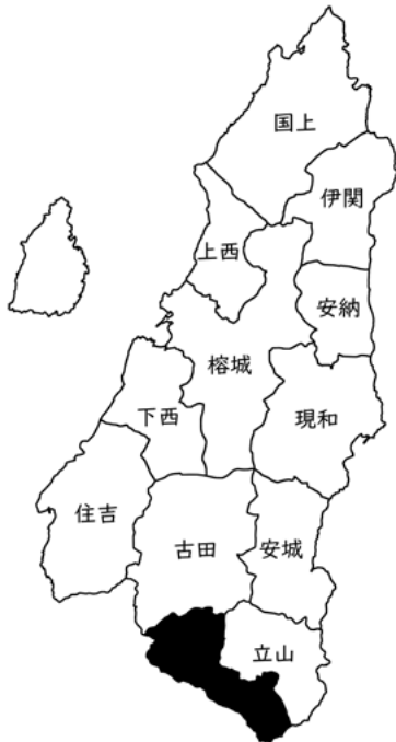
図8-26 中割校区の位置

種子島のほぼ中央に位置し、市街地から約二〇キロほど離れた遠隔・山間地で、十六番・万波・生姜山・千段峯の四集落から成る。大正三年（一九一四）の桜島大正噴火で罹災した方々の移住などにより中割の地が興され、平成二十六年（二〇一四）に廃校になった鴻峰小学校も、大正三年の十一月に建てられた。昭和三十年代頃までは炭焼き（木炭）などで隆盛を極めていたが、バブル期の終焉とともに地域力の低下が進んだ。