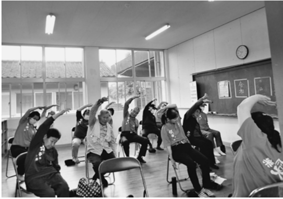
「楽笑会」活動の様子