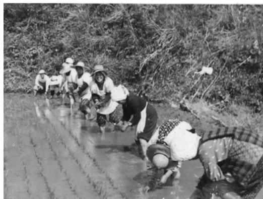
田植えの様子（昭和30年代）