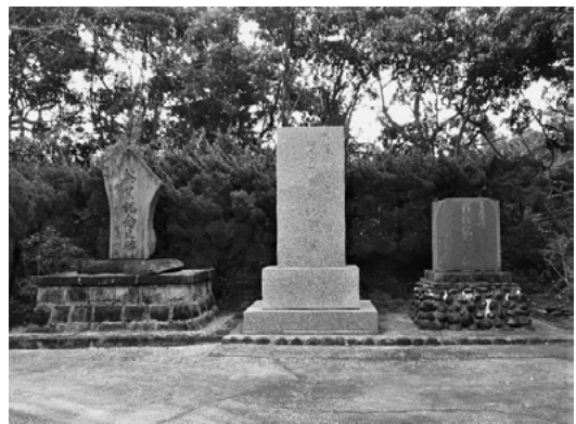
番屋峯移住記念碑