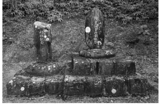
十三番移住記念碑と陸軍演習記念碑

が熊野神社へ参拝に出かけた際に、十三番付近に耕地に適した土地があり安住の土地として最適と思い、妻の実父である是枝家と移住したのが始まりである。