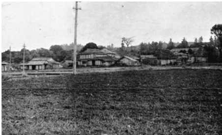
昔の古田の街並み