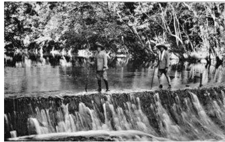
古田水力発電所堰堤