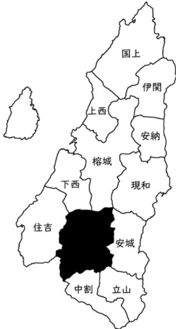
図8-28 古田校区の位置

気候は、高温多雨で時期により霧の発生も多く、冬季は、降霜がみられ島内の中でも寒冷地である。地形は、中央部に古田盆地が広がり、その周りを台地や丘陵地で囲む山林地帯から成り立っている。地質は、肥沃な堆積層や粘土層が分布している。自然豊かで、山桜・河津桜・暖流桜・ソメイヨシノなど二カ