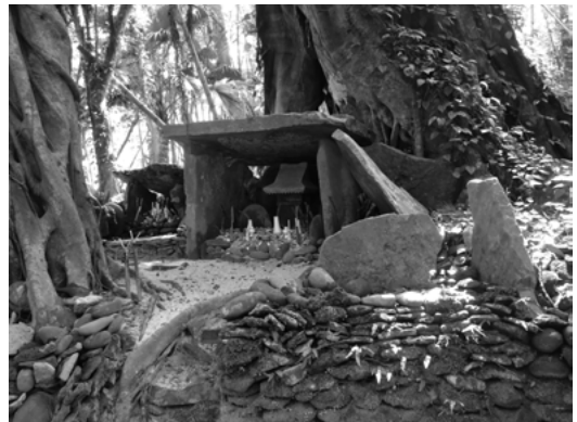
軍場神社本殿（手前が大山祇神）

「オク」と呼び、許された人のみが入ることができる。小川に架けられた、これが橋だと気付かないくらいの橋を渡り一五歩ほどの階段を登ると、やがて小道は二手に分かれている。右側の細い道を下ると水の湧き出ている小さな泉があり、ここを水源として小川が流れている。この小さな泉は禊場や清掃等に利用されている。左側に進むと参道は行き止まりとなり、左手に五〇センチほどのステージ状の構造物がある。周囲はおびただしい数のサンゴ石によってしっかりと境界が作られ、アコウの巨木が覆いかぶさるように頭上にそびえる。このアコウの巨木に抱きかかえられるようにして、多少大きさに違いはあるもの自然石の板石を利用した祠状の構造物二基がある。ここが、本