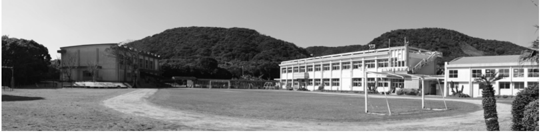
現在の安納小学校