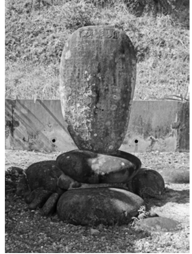
日高半十郎顕彰碑