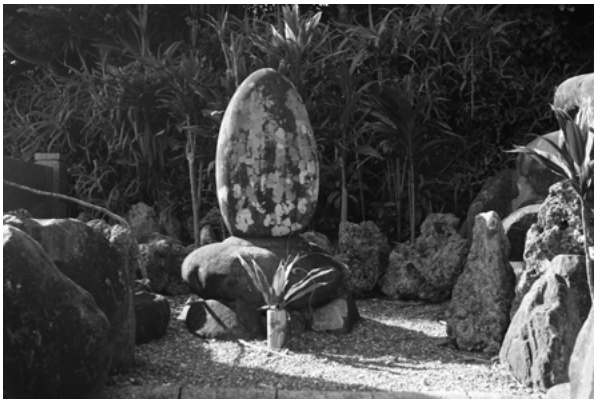
花ノ木浦開祖の碑

軍場にあるこの字は、昔種子島の殿様が鹿狩りにこの地に立ち寄った際、馬の鞍を松に掛けたことにちなんでつけられたという。