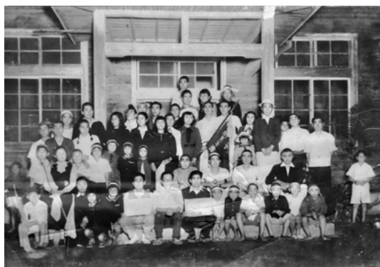
校区大運動会（昭和26年）