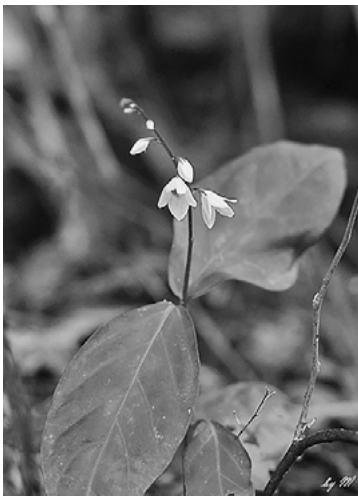
安納川の川辺に咲く「アリモリソウ」

当時は、カライモや麦飯などを食べていました。空襲があると、自分たちで作った粗末な防空壕に入りました。夕方空襲警報がなり、家族とともに山で一夜を明かしたことも四〜五回ありました。一七・一八歳の頃、増田飛行場（中種子町）の整地のため一〇日間ほど駆り出され、男性が崩した土砂をトロッコに積んで捨てたこともありました。現在、他国で戦争が起きていますが、「自分の家族が戦死したとしたらどう思うのか。自分は正しいことをしていると思っているのか。」それを問いかけたいです。