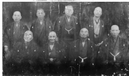
校区の発展に尽力した人々 （昭和10年頃）