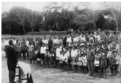
朝礼（昭和10年頃）