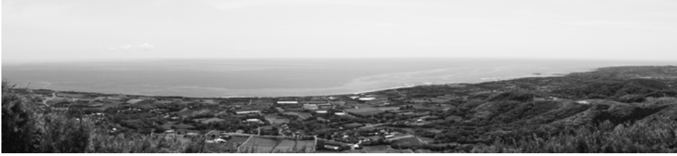
天女ヶ倉から太平洋を望む