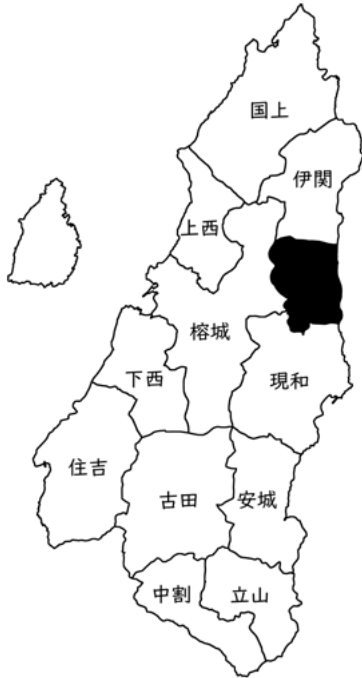
図8-11 安納校区の位置

安納校区は、種子島の北東部、東海岸に面しており、西之表市街地の東部約五〜六キロメートル離れたたなだらかな台地上に位置している。北は伊関校区、西は榕城校区、南は現和校区と境を接し、東側は広大な太平洋に臨み、集落は安納川北岸沿いの大平・峯・下郷の三集落と伊関校区に隣接する軍場集落から成り立っている。