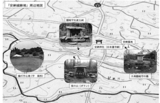
「安納城跡地」周辺地図