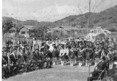
安納小学校創立100周年記念 （昭和55年）