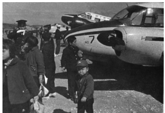
西之表市営飛行場

跡地は、日活映画「零戦黒雲一家」のロケ地として使用されたり、砂利採取地としての利用もあったが、現在は勤労者体育センター（西之表市営球場、昭和六十年二月二十八日工事完成）や車エビ養殖場（平成元年設置）等に利用されている。