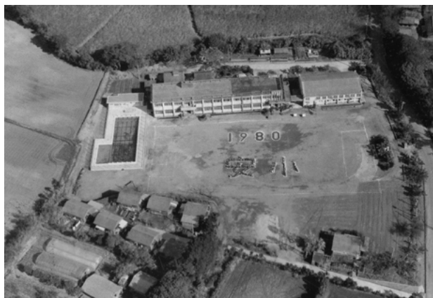
安納小学校全景（昭和55年）