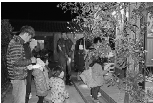
蚕宮城と「カンザー」

十四日の晩に、子どもたちは一団で各家をまわり、玄関の所 で、「お祝い申す おつきやい申すか おつきやい申すか 年 頭のご祝儀上げ申す」で始まる蚕宮城 このみやじょう の歌を合唱する。その後、 お礼として餅をもらい、背負ったカンザー このみやじょう （ミチシバシチト ウイで作った物入れ）に入 れて引き揚げるといいう行事 である。最近では、時代の 流れか、お菓子やご祝儀を くださる家庭が増加してい る。