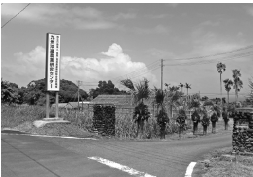
九州沖縄農業研究センター

また、郷土の歴史や文化遺産にも恵まれており、郷土芸能の継承（棒踊）にも地域と小学校が一体となって取り組んでいる。