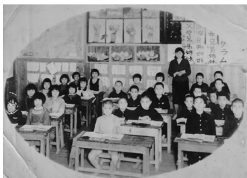
ある日の教室（昭和33年）