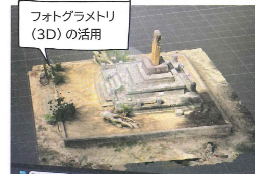
フォトグラメトリ(3D)の活用

≧ その他にも… 市文化財関連施設の整備・充実 歴史文化イベントの企画・実施 など