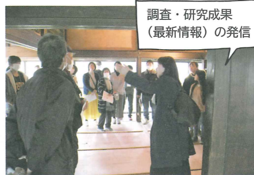
調査・研究成果(最新情報)の発信