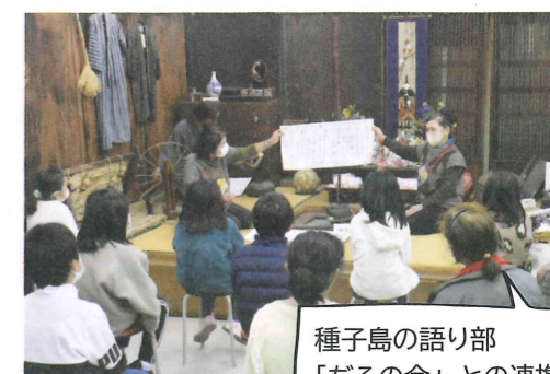
種子島の語り部「ぢろの会」との連携