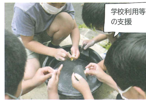
学校利用等の支援