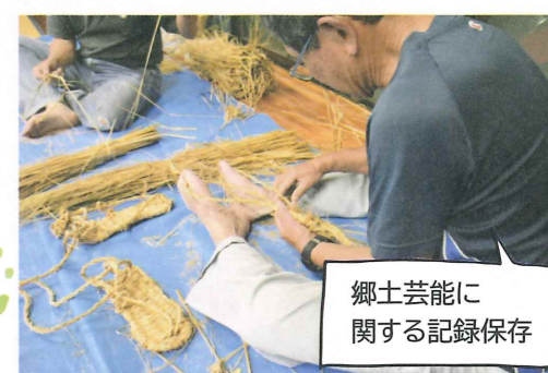
郷土芸能に関する記録保存