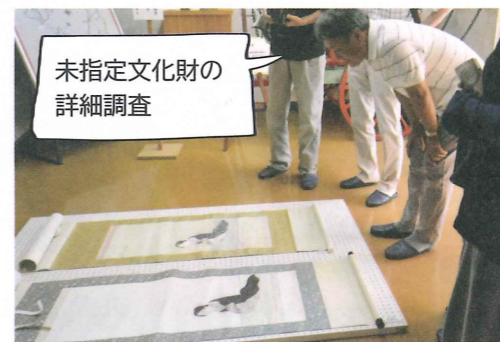
未指定文化財の詳細調査