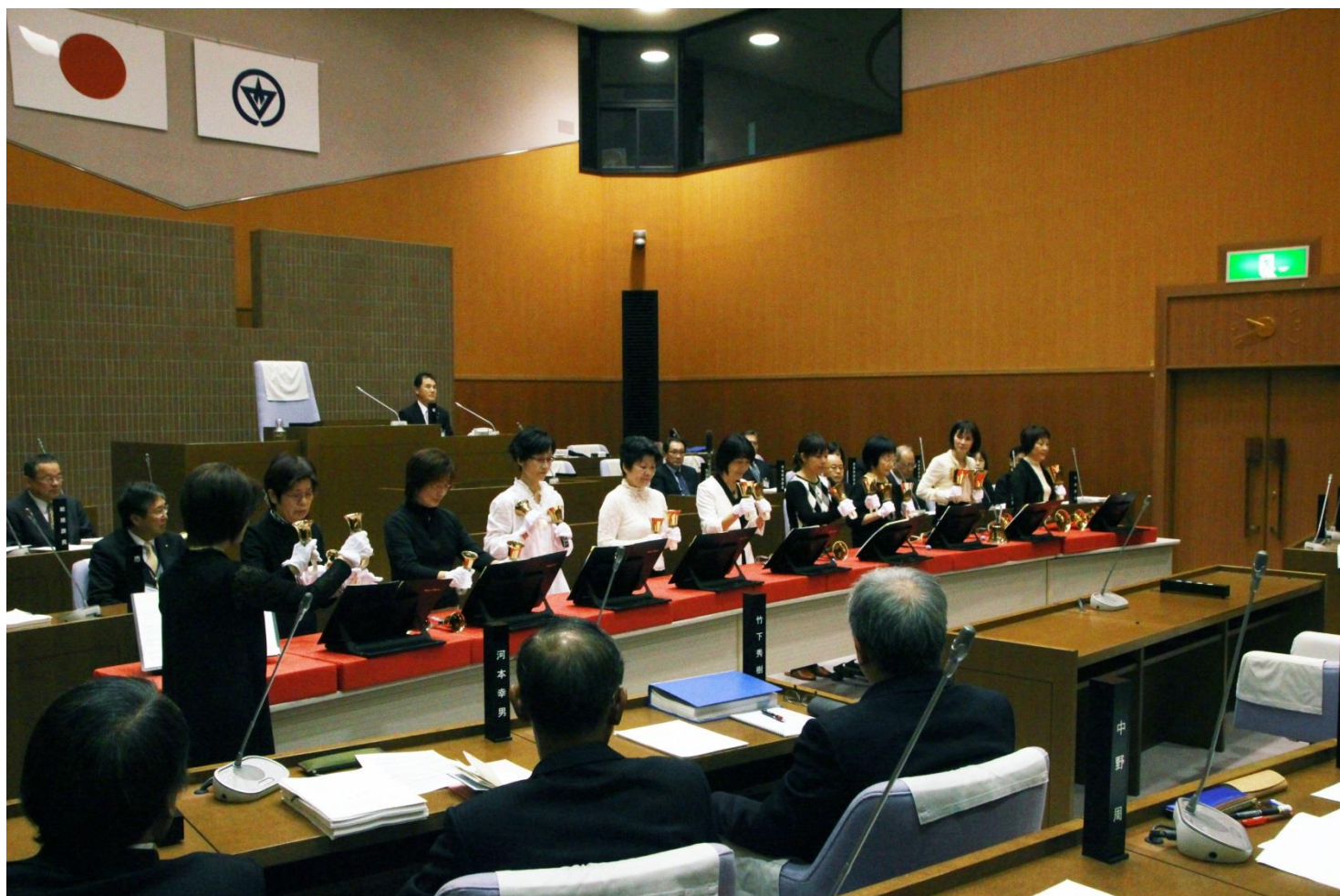
▲しまのねリンガーズ ハンドベル演奏（詳細 P 1 3 ）