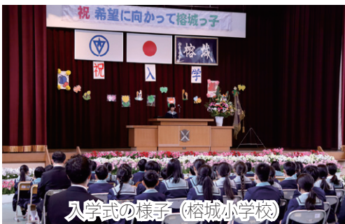
入学式の様子 (榕城小学校)

4月8日(水)、種子島高校と中種子特別支援学校で入学式が行われ、それぞれが新たな学校生活を迎えています。 また、4月9日(木)には、市内小・中学校でも入学式が行われ、種子島中学校では、113名の生徒が新たな門出を迎えました。