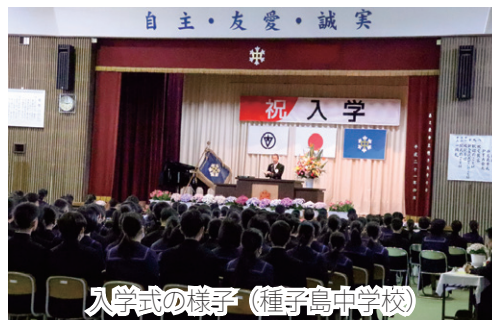
入学式の様子 (種子島中学校)