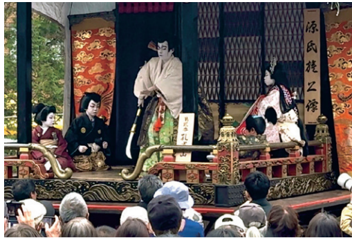
▲「一条大蔵譚」終盤の場面

「種子島年中行事」（熊毛文学会発行）によれば江戸時代、正月に島主の館で、西町と東町はそれぞれ舞を披露して年始を祝ったそうです。種子島に伝わる踊りや芸能には歴史が息づいています。伝統を守る取り組みを学ぶため、今後も長浜市との交流を続けていきます。私たちも、こどもたちの未来のために、ふるさとの祭りをしっかり盛り上げていきたいものです。