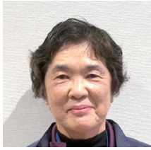
①阿世知 はつみ ②深川 ③深川・里之町