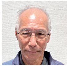
①芝 和廣 ②納曽 ③納曽・天神町 ・田屋敷