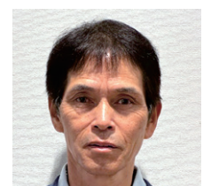
①古元 康徳 ②上石寺 ③下石寺・上石寺