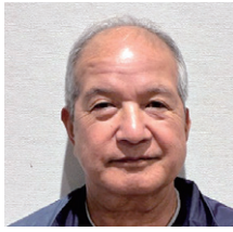
①南 勝 ②桜園 ③桜園