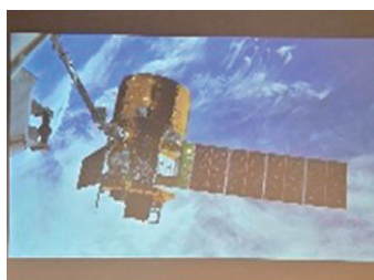
「宙景」 HTV-X の映像

宇宙科学技術館の東館 2 階ステーションエリアの演出装置「宙景」をリニューアルしました。2025 年 8 月に国際宇宙ステーション（ISS）に行った油井宇宙飛行士が ISS から撮影した地球や新型宇宙ステーション補給機 HTV-X の映像を紹介しています。宇宙科学技術館に来館した際はぜひご覧ください。