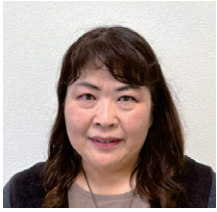
①當 百江 ②古田中之町 ③村之町・番屋峯・二本松・十三番