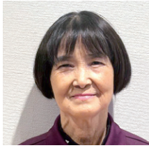
①河路 君江 ②安城上之町 ③安城上之町・平山・平園