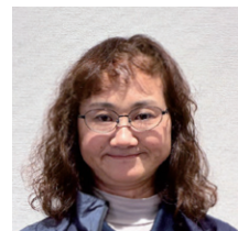
①西 ちかえ ②美浜町 ③美浜町（古園）