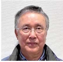
①小川 隆和 ②古田上之町 ③古田上之町・中之町・平松