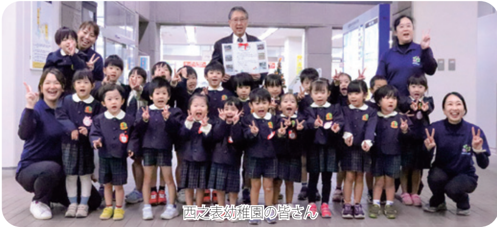
西之表幼稚園の皆さん

「勤労感謝の日」に合わせて、11月21日（金）に西之表幼稚園の皆さんが市役所を訪問してくれました。園児の皆さん、ステキなお手紙のプレゼント、ありがとうございました。