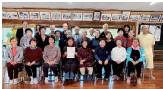
▲教室に参加されたサポーター、参加者の皆さん

教室開始時と終了時には MMSE（認知機能障害を簡易的にスクリーニングできる検査）を実施し、教室参加者の 84% の方の認知機能が 維持改善されている という結果になりました。