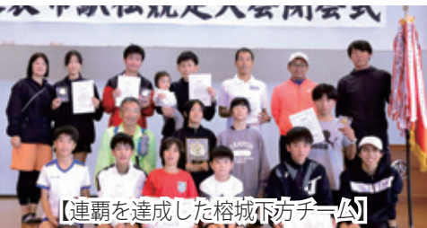
【連覇を達成した榕城下方チーム】