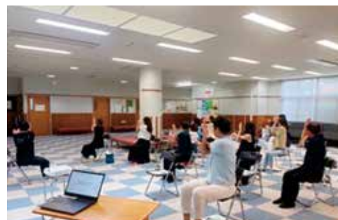
▲地域おこし協力隊 篠木優子氏 によるヨガレッスン