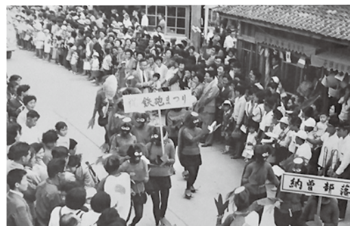
仮装行列でにぎわう昭和の東町商店街

鉄砲伝来が縁の友好都市で結ばれる、種子島火縄銃保存会と国友（滋賀県長浜市）、堺（大阪府堺市）の3鉄砲隊による試射演武を交え、太鼓山、子供みこし、南蛮行列、団体手踊り、宣伝パレードに続いて夕方から演芸大会、最後は約六千発の花火大会で盛り上げました。