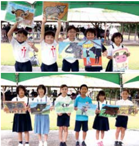
▶牛の絵コンクール 1年生～3年生の部入賞者（上） 4年生～6年生の部入賞者（下）