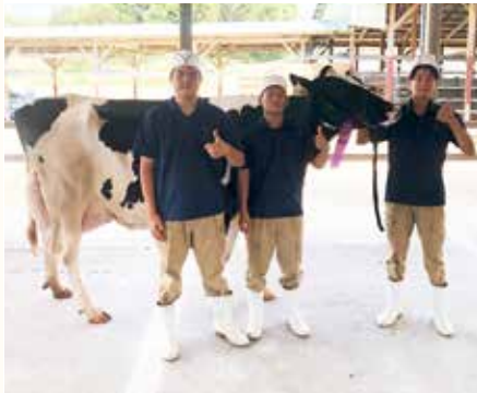
▲「ズワルチエ ベイリー リステイ」