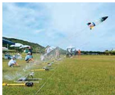
▲水ロケットの力強い発射

は「遠くまでロケットを飛ばすことが難しいことだとわかった」といった感想が聞かれるなど、楽しみながらロケットについて学ぶ機会となりました。