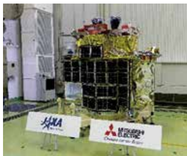
小型月着陸実証機「SLIM」の機体

SLIMは、種子島宇宙センターから、H-IIAロケット47号機で打上げ予定です。応援よろしく願います。