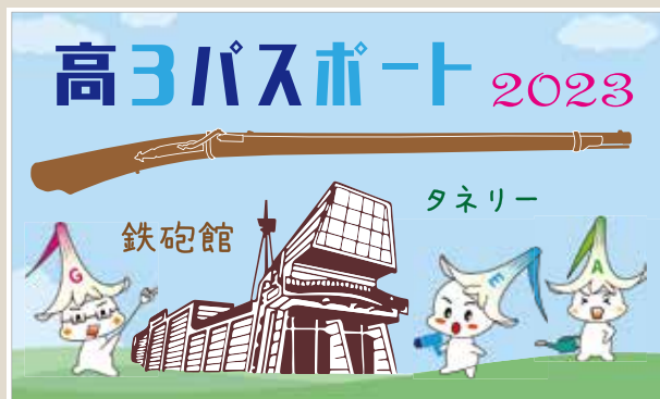
▲種子島高校キャラクター「タネリー」

その他、全ての方を対象とした無料入館を、第54回種子島鉄砲まつりに合わせて、8月19日(土)・20日(日)に実施いたします。鉄砲伝来に関するポルトガル初伝銃や国産第一号火縄銃のほか、種子島の歴史文化や魅力を伝える品を多数展示しています。開館40周年を迎えた鉄砲館では、新しい3D技術の導入に取り組むなど、日々進化を心がけています。ぜひ、ご来館ください。