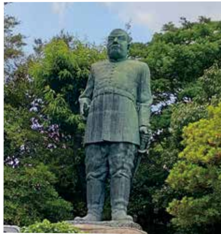
国道58号を見下ろす西郷隆盛像

海上区間は計610キロ。島々の連なる海には度々、暫定国境線が引かれました。まず、敗戦国日本が占領下に置かれた1945（昭和20）年、北緯三〇度線より北にある旧十島村の上3島（竹島・硫黄島・黒島、現三島村）が鹿児島県に編入され、分離された南