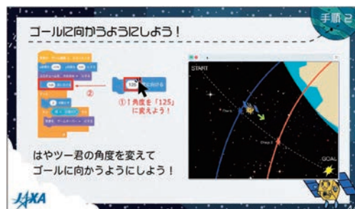
▲スクラッチを用いたプログラミング「はやぶさ2地球帰還編」

例えば、プログラミング教材の「はやぶさ2地球帰還編」は、プログラミングを体験・学習し、小惑星探査機はやぶさ2の地球帰還ミッションゲームを作成する内容となっています。教材の手順通りにプログラムを進めるだけでなく、続きのストーリーを作るなど様々なアレンジが可能です。