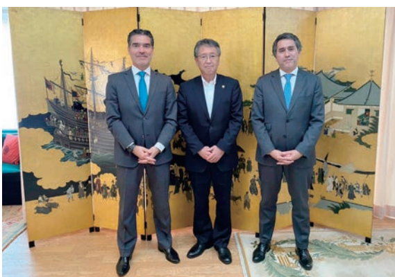
セレーノ大使（左）とアンドレ外務副大臣とともに ＝東京・六本木のポルトガル大使公邸で

来年2023年は、鉄砲伝来480周年。西国交流の記念行事に国を挙げて取り組む構想が進められているそうです。西之表市は、ヴィラ・ド・ビスポ市との姉妹都市締結30周年を迎えます。セレーノ大使は、ともに480周年事業で協力しよう、ヴィラ・ド・ビスポ再訪も実現してほしい、自分も種子島をぜひ訪ねたいとこやかに語り、私と堅い握手を交わしました。