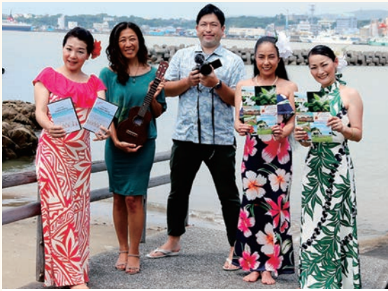
フラ・タヒチアンダンスで島の魅力をPR