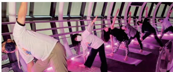
▲国際ヨガの日 スカイツリーヨガ

国際ヨガの日に先立って 6 月 13 日(月)に開催されたヨガ推進議員連盟のヨガでは、ヨガの聖地第 1 号として全日本ヨガ連盟大橋理事長から取組みが紹介されました。