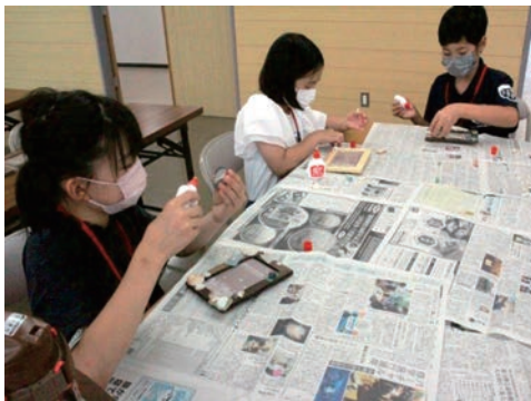
▲ フォトフレーム作りの様子