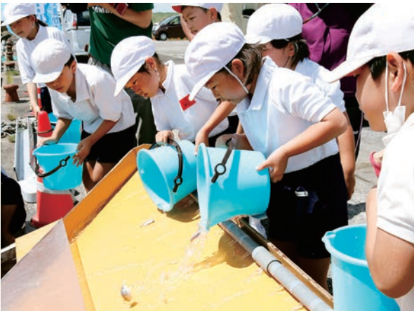
伊関小児童がマダイを放流

岐阜県の山之村小学校とオンライン学習会(安納小) 6月23日(木)、安納小学校で、岐阜県飛騨市立山之村小学校の児童と「安納芋」をテーマにしたオンライン学習会が行われました。 山之村小の児童が、安納芋について調べたことを発表し、安納小の児童に質問を行いました。 安納小の児童は、「県外の学校の児童と交流して、少し緊張したけれど楽しかった」「安納芋のことをたくさん教えることができた」と話しました。