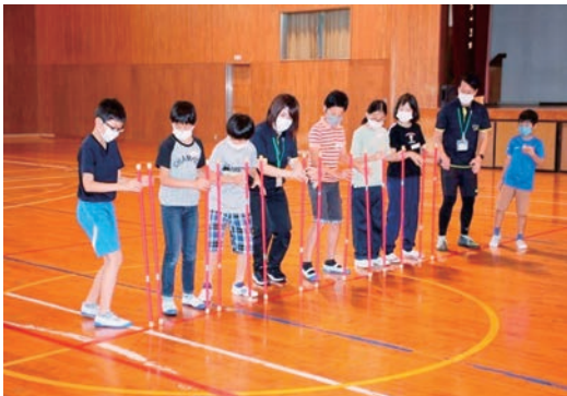
▲ キャッチング・ザ・スティックの様子

子ども達は班ごとに分かれ、対抗戦を行い、競技に夢中になりました。また、相手チームのことを応援する場面も見られました。