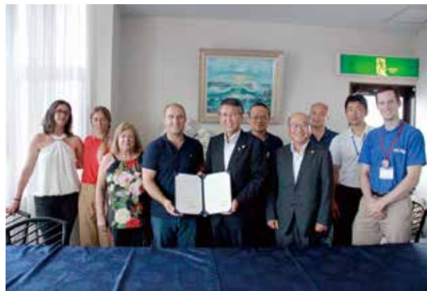
▲ヴィラ・ド・ビスポ市と今後の友好を約束

本市姉妹都市との交流を深めた1年でもありました。伊佐市（旧大口市及び菱刈町）とは合併後も姉妹