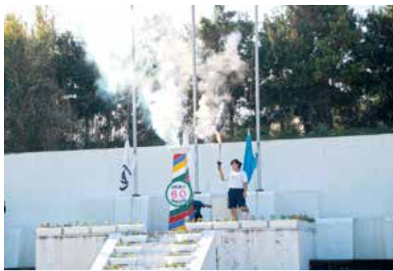
聖火台に点火(2018年の市民体育祭)

ところで、2018年の市民体育祭で市営グラウンドに聖火トーチが登場したので記憶の方もおられるでしょう。その夏、東京で開かれた、出郷者の皆さんが集まる関東種子島会の総会で、トーチメーカーの経営者から市にトーチ多数を寄贈していただきまして、さっそく市民体育祭や希望する校区の体育祭などで使われ、大会の盛り上げに一役買ったわけです。聖火は1964(昭和39)年の東京オリンピックでは来島せず、種子島に聖火ロードが組まれるのは史上初めてです。またとない機会に子どもたちの夢をばぐみ、故郷をPRするチャンスととらえています。 西之表港は県内5か所の重要港湾の一つであり、熊毛地域発展へ、耐震岸壁などの防災やクルーズ船来航増などの観光はじめ産業育成を視野に、新たな港湾計画づくりに県や国との協議を進めている最中です。聖火ロードを「港町再生」の契機にしたいものです。