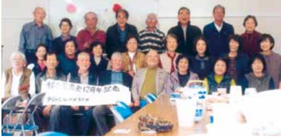
岳之田公民館での交流会で記念撮影

11月30日(土)、岳之田地区と山川福元地区(指宿市)の交流会「福岳交流会」が行われました。1884年(明治17)、山川の人々が移住した歴史がある岳之田地区。平成19年に山川地区が岳之田地区を訪問したことをきっかけに、交流が続いています。 この日は、山川地区から8名が出席し、先祖の墓参りを行いました。その後の交流会では、記念に「菜の花マラソン」の菜の花の種や安納いもなどを贈り合いました。