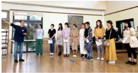
▲介護施設見学の様子 (百合砂苑)

■問い合わせ先 市役所地域支援課協働推進係 ☎ 22 - 1111 内線 214