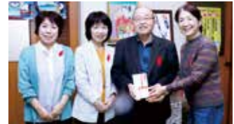
▲募金を手渡す実行委の皆さん