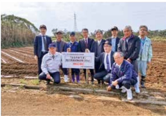
▲3月「はるのおうぎ」の苗を植付（実証ほ場・中種子町油久）

大きな台風被害も無く、生育も順調で、反収も平年を上回っているようです。2020年には、九州沖縄農業研究センターなどが、熊毛地域向けに開発した新品種「はるのおうぎ」の原苗生産が本市で開始される予定となっております。多収や植替え頻度の低減による省力化などが期待されます。