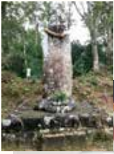
◀ 山川移住 しやうとく 徳碑