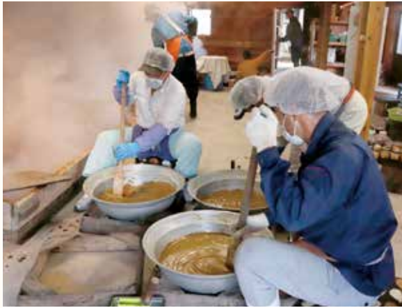
アメ状になった黒糖を練り上げる作業

11月30日(土)、語呂合わせで「い いさとつこの日」に、新光糖業、大 東製糖(中種子町)、沖ヶ浜田黒 砂糖小屋の3会場で「さとつぎび フェス」が開催されました。 これは、種子島のさとつぎび産 業、砂糖の文化などを体感しても らおうと、さとつぎびの島種子島 実行委員会が主催したものです。 沖ヶ浜田会場では、伝統的な黒 糖づくりの見学・試食が行われ、 来場者は、手作業で作られた黒糖 を味わいました。