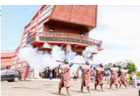
▲鉄砲館入館者150万人記念セレモニー

結びに、新年を迎えるにあたり、皆さまのご健康とご多幸をお祈りし、私のご挨拶いたします。