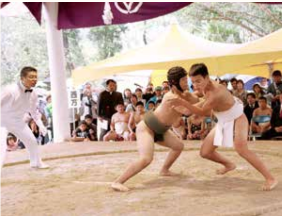
中学生の部・優勝を決めた大将戦