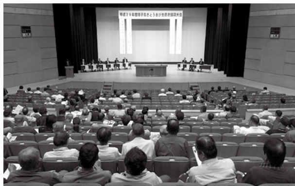
平成29年度種子島さとうきび生産者振興大会の様子