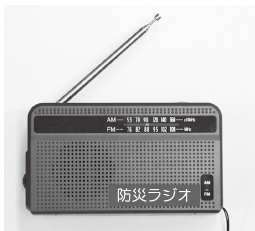
新しい防災行政無線の防災ラジオ ※写真はイメージです。

（ただし、通常のラジオ放送が聞き取りにくい地域、場所によっては聞こえない地域もあります）