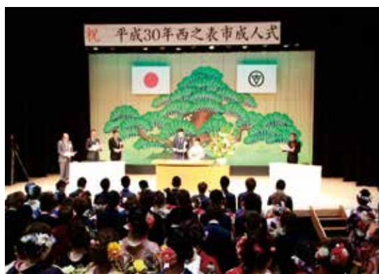
市民会館で開かれた式典

さて、今年の成人式で、晴れ着姿の新成人が「今、大学で学んでいることで故郷の役に立ちたい」と抱負を語るのを聞き、うれしくなりました。この若者たちが再び帰って来れるような島にしなければならぬと、私も気持ちを引き締めました。