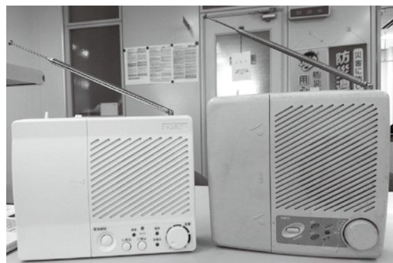
各世帯に設置している防災行政無線の戸別受信機

市役所まで来られない方は、市総務課防災消防係（22-1111）へご連絡ください。