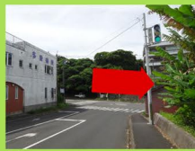
②突き当たりを右折