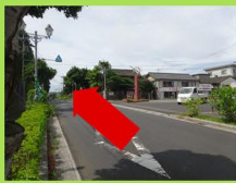
①鉄砲館を右手に直進