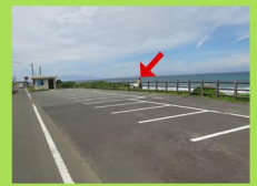
海岸線沿いに現れる 駐車場が目印