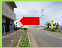
③突き当たりを左折