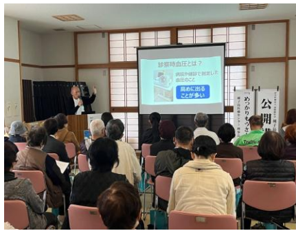
イベントコーナー