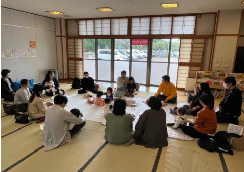
イベントコーナー

親子マッサージや公開講座をはじめ、健康に関する相談・測定コーナー、介護予防の体力測定、野菜摂取量の測定、また関係団体によるミニバザーや味覚テストなどを行い、多くの方にご来場いただきにぎやかなフェスタを開催することができました。