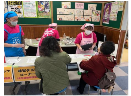
食に関するコーナー