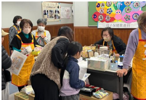
物品販売コーナー