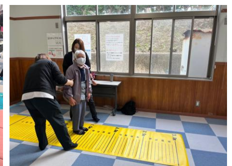
体力測定(介護予防)コーナー