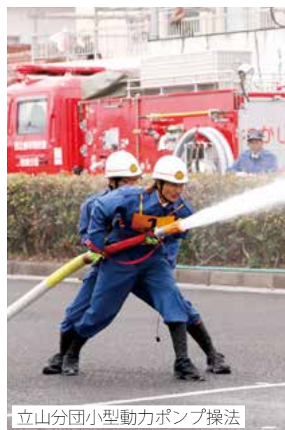
立山分団小型動力ポンプ操法

1月12日(日)、令和2年西之表市消防出初式を開催しました。 市消防団、西之表消防署などの関係者による市中行進で始まり、市民体育館では、女性分団が規律訓練を行いました。「ひとつずついいね!で確認火の用心」と書かれたカードを掲げ、2019年度全国統一防火標語をPR。「女性分団団員募集中!!」も合わせてアピールしました。また、立山分団が小型動力ポンプ操法を披露し、幼年消防クラブ(西之表幼稚園の園児など)は、消防車との綱引き勝負を行いました。その後、西之表消防署員が、救助総合訓練を披露。災害時における要救助者の救出を想定した訓練を行いました。 式典では、地域防災への功績が認められた消防関係者に対する表彰などが行われました(左に記載)。