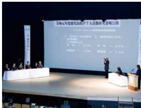
▲研究協議・パネルディスカッション

12月7日(土)、市民会館で県PTA活動研究委嘱公開が開催されました。 今年度の担当校である種子島中学校PTA会員の皆さんが『家族の絆「ひとりだち」を支えるPTA活動』をテーマとした研究協議を行いました。研究内容をより深く参加者に理解してもらうために、初のパネルディスカッション方式を採用し、活発なディスカッションが展開されました。 最後には、種子島中学校が製作し