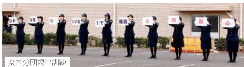
女性分団規律訓練