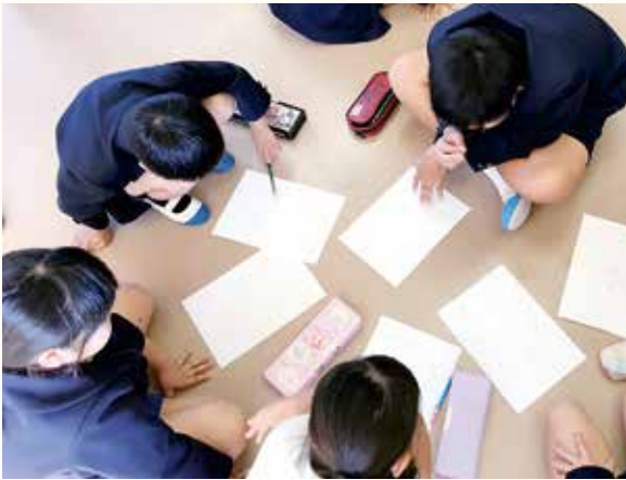
児童向けワークショップの様子

12月4日(水)、上西小学校で男女共同参画学びの広場推進事業が開催されました。これは、子どもの頃から男女共同参画への理解を深めてもらうため、学校等でワークショップやセミナーを開催するもので、この日は、児童・教職員・保護者それぞれに向けた研修が行われました。受講者は、子どもも大人も、性別に関わらず、人それぞれ個性や能力があることに気づき、大切にするのが大事だと学びました。