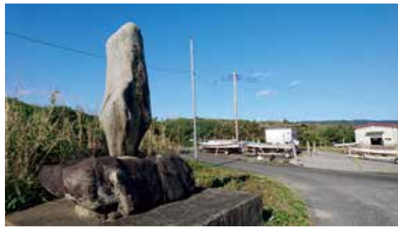
平草漁創始者顕彰碑＝庄司浦漁港

近年の漁業不振の要因に地球温暖化がいわれる中、「藻場復活が漁業再生の力」と、改めて思います。