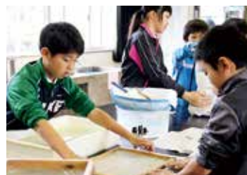
作業をとる気水後紙すき

12月18日（水）、安納小5、6年生の児童が、サトウキビのバガス（しぼりかす）を活用