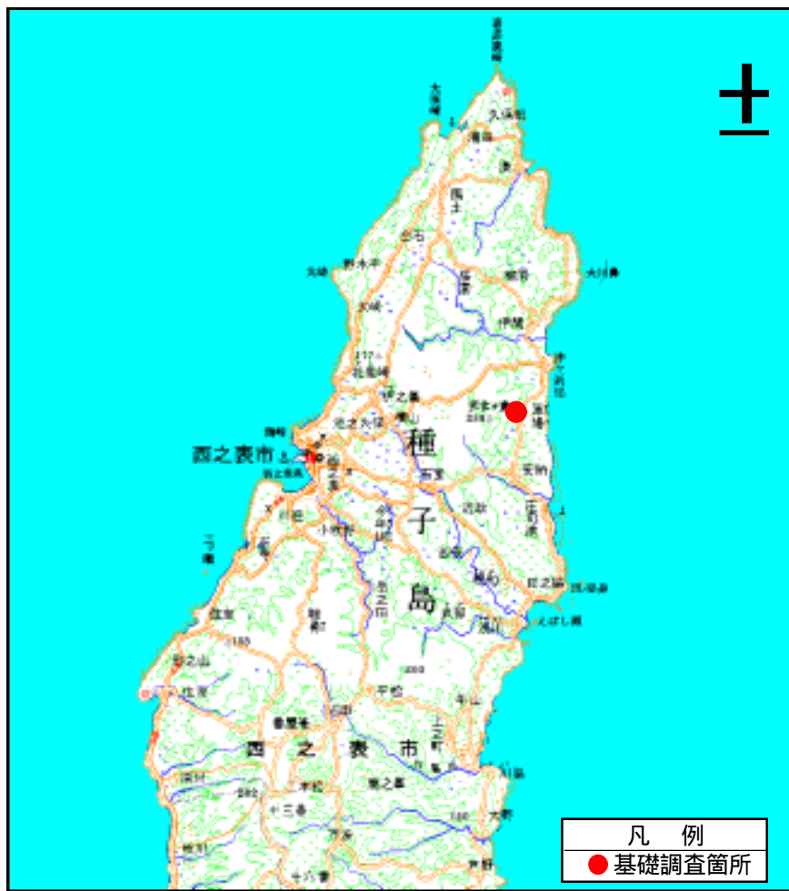
( 1/200,000 )