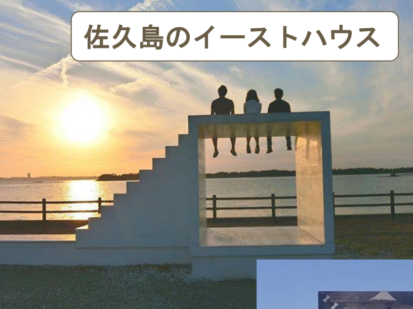
佐久島のイーストハウス