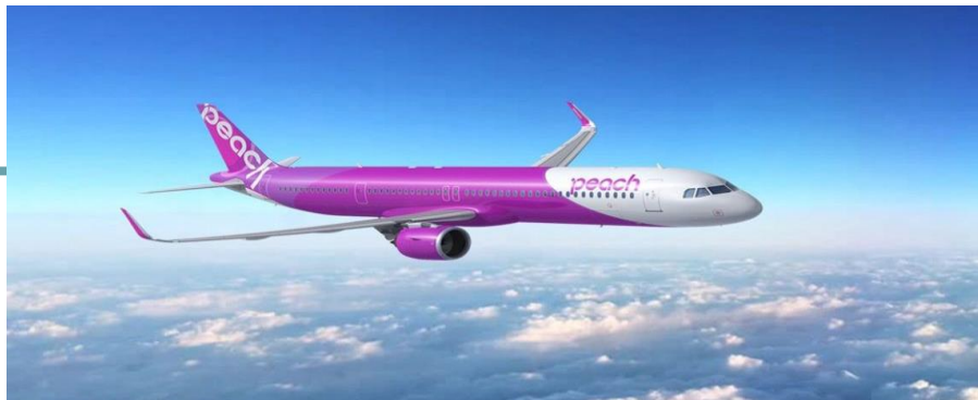
Peachが2020年度内に受領予定のエアバスA321LRのイメージ写真