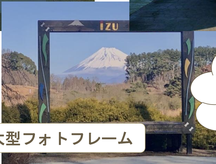
伊豆市の大型フォトフレーム